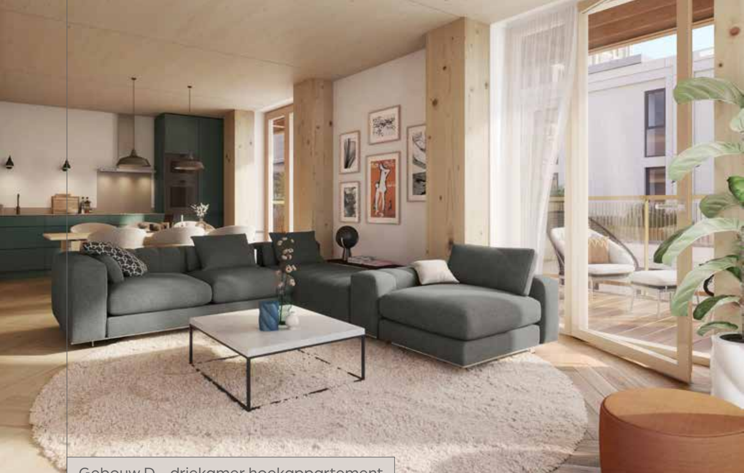
Gebouw D – driekamer hoekappartement

Dit hoekappartement is voornamelijk opgetrokken in houtbouw. Je ziet dat direct aan het plafond. De woning is georiënteerd op de groene Naritaweg of op de binnentuin. Bij een aantal woningen is een deel van het balkon ingericht als loggia, daardoor kun je 's winters beschut buiten zitten.