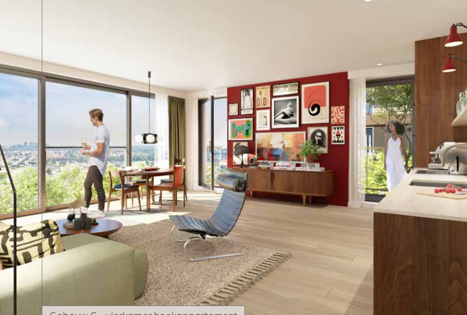
Gebouw C – vierkamer hoekappartement

Dit hoekappartement heeft een XL-size! Het is ruim genoeg voor drie slaapkamers. De woonkamer ligt op het zuiden. Je hebt veel daglicht in de woonkamer en je kunt al vroeg in het voorjaar buiten zitten.