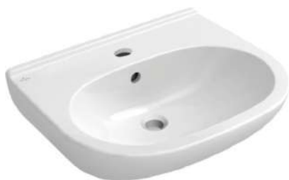
Wastafel Villeroy en Boch O'Novo