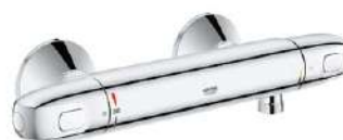
Douchemengkraan Grohe Grohtherm 1000 met cooltouch