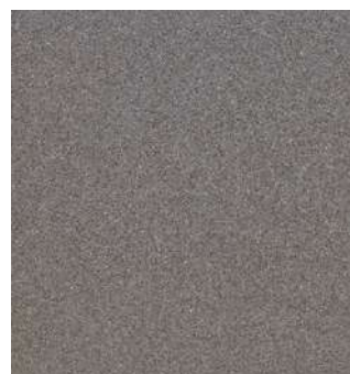
Vloertegel 30x30cm antraciet met een grijze voeg en 15x15cm in de douche hoek. Hoekprofiel wit recht

KLEUREN VAN DE AFBEELDINGEN ZIJN TER INDICATIE