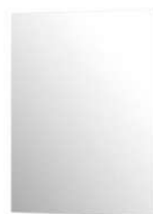
Spiegel 50x75cm stand gemonteerd

* Voor Woningtypes : B01, B02, B03, B04, B06, B07, B08, B09, B10, B11, B12, B13, B14 en B15