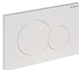
Bedieningspaneel Geberit Sigma 01 wit