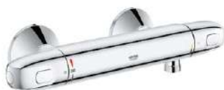
Douchemengkraan Grohe Grohtherm 1000 met cooltouche