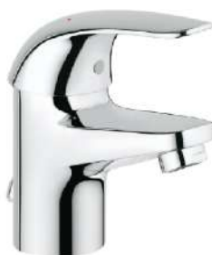
Kraan Grohe Euroeco