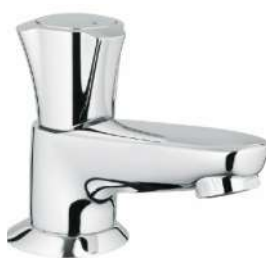
Kraan Grohe Costa L