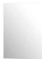
Spiegel 50x75cm Liggend gemonteerd