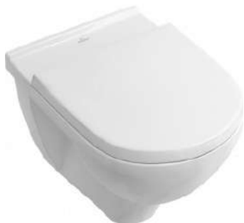
Wandcloset Villeroy en Boch O'Novo