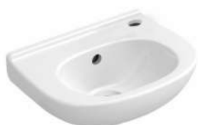
Fontein Villeroy en Boch O'Novo