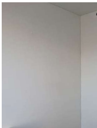
Wand afwerking Wit Mat